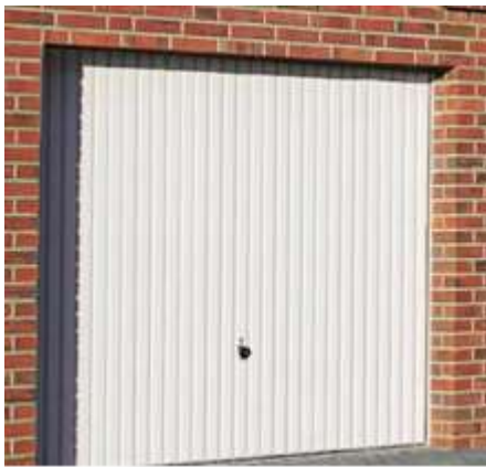
Kein Originalbild nur typähnlich

(Achtung Bilder sind nur typähnlich – keine Originalbilder)